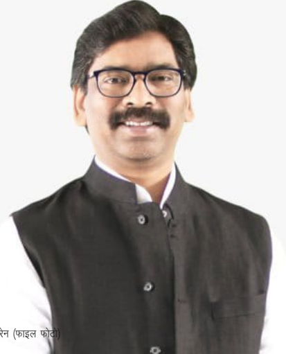
हेमंत सोरेन (फाइल फोटो)

रांची– कोरोना के कहर के बीच लॉक डाउन के दौरान विभिन्न राज्यों में फंसे झारखंडी मजदूरों और छात्रों को निकालने को लेकर झारखंड के मुख्यमंत्री हेमंत सोरेन ने केंद्र सरकार पर तीखा प्रहार करते हुए कहा कि जब यूपी के बच्चों को निकालने के लिए बसें भेजी जा सकती हैं तो झारखंड के साथ अन्याय क्यों? आपको बता दे कि मुख्यमंत्री हेमंत सोरेन ने केंद्र सरकार पर तीखा हमला बोलते हुए कहा कि उत्तर प्रदेश के